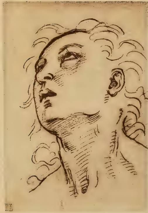
Dessin pour la tête de l'apôtre Saint Jean